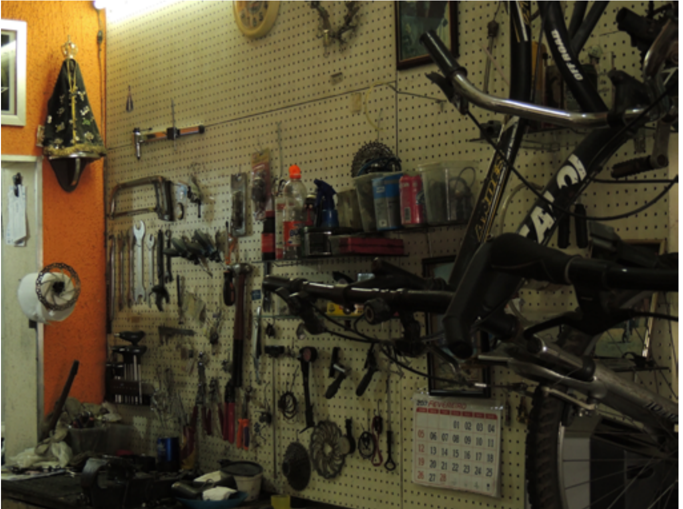
Bicicletaria em Aparecida (SP). 2017.