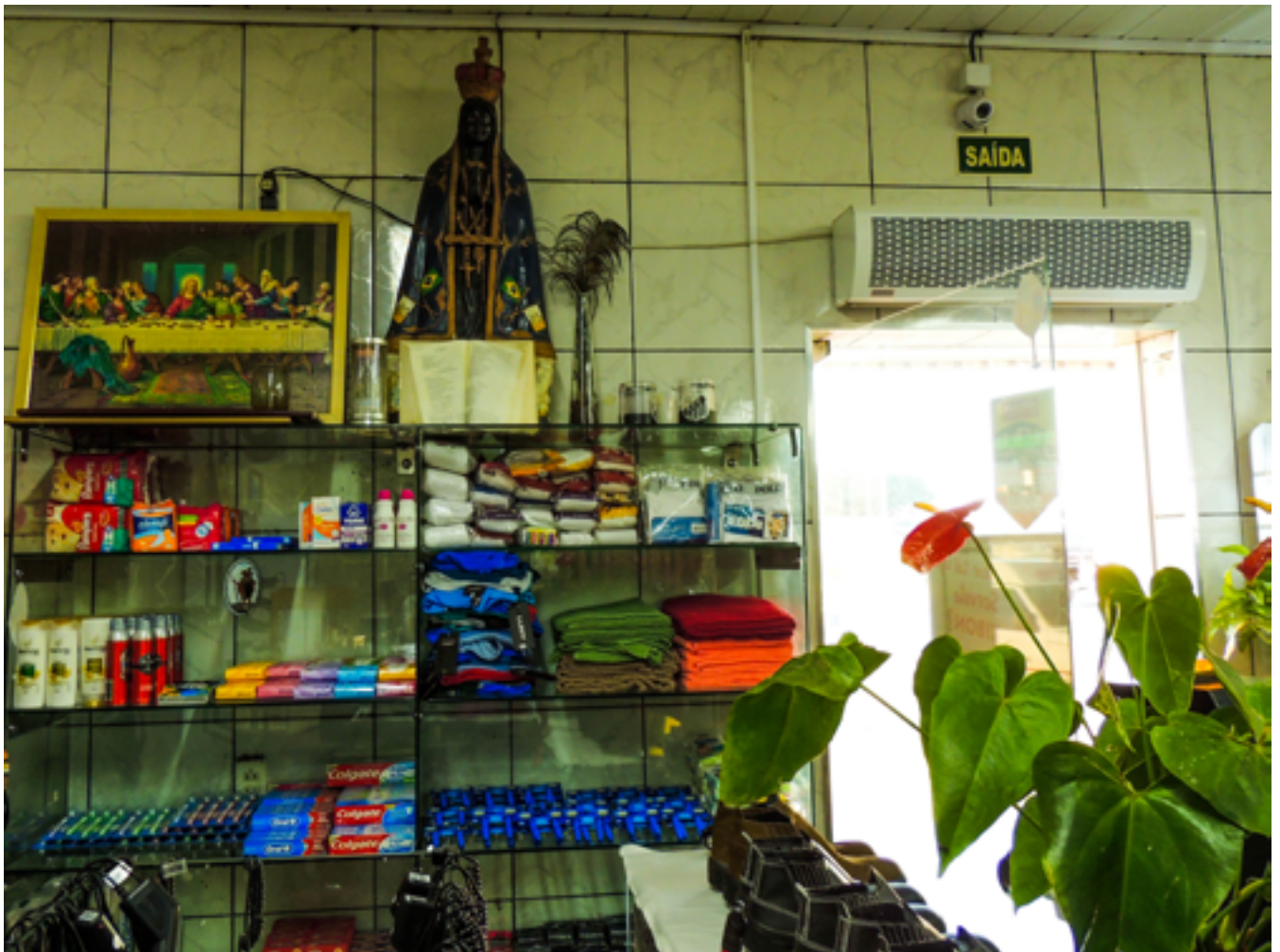
Restaurante e Merceria em Cordeirópolis (SP), 2016.