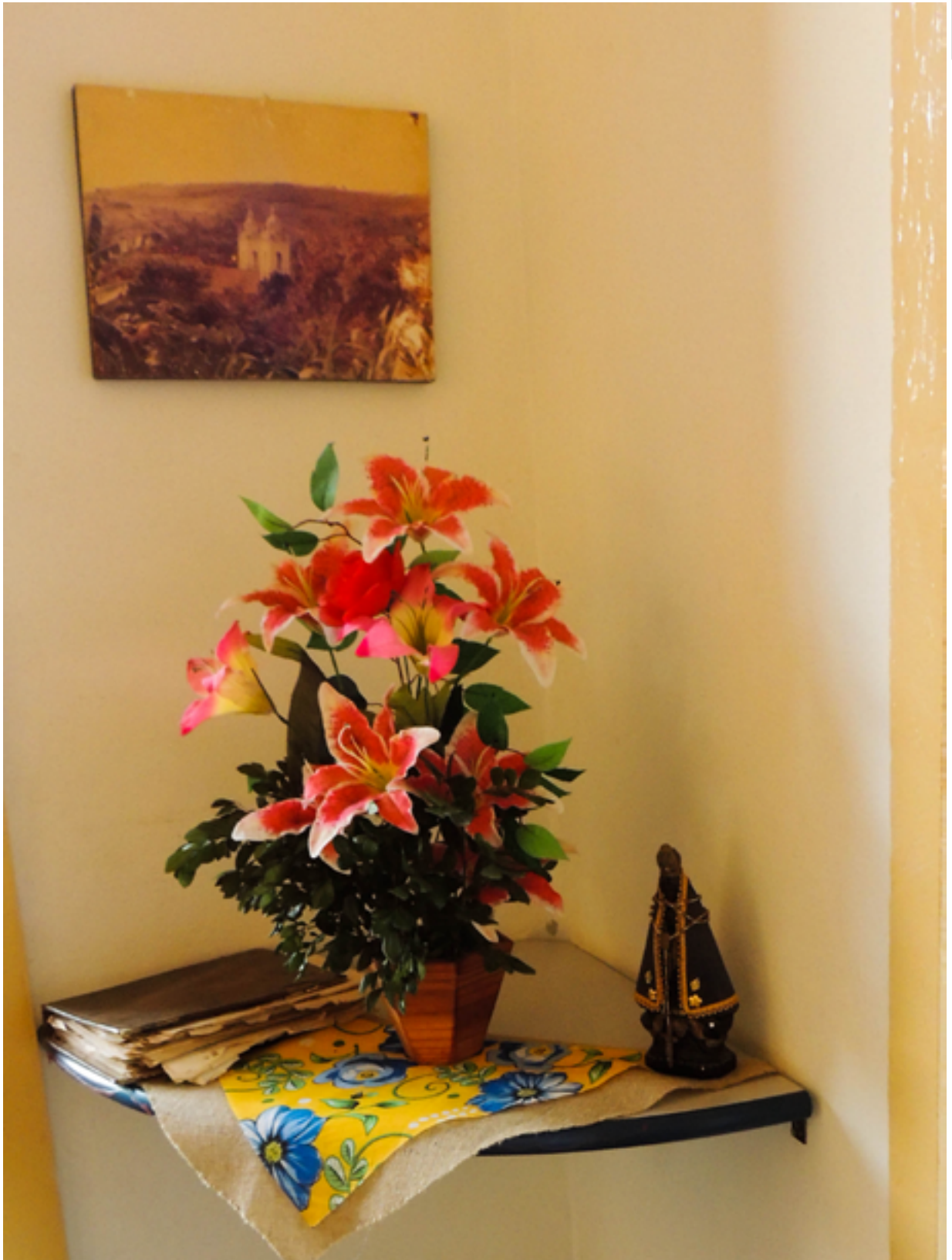
Museu Municipal de Areias (SP), 2016.