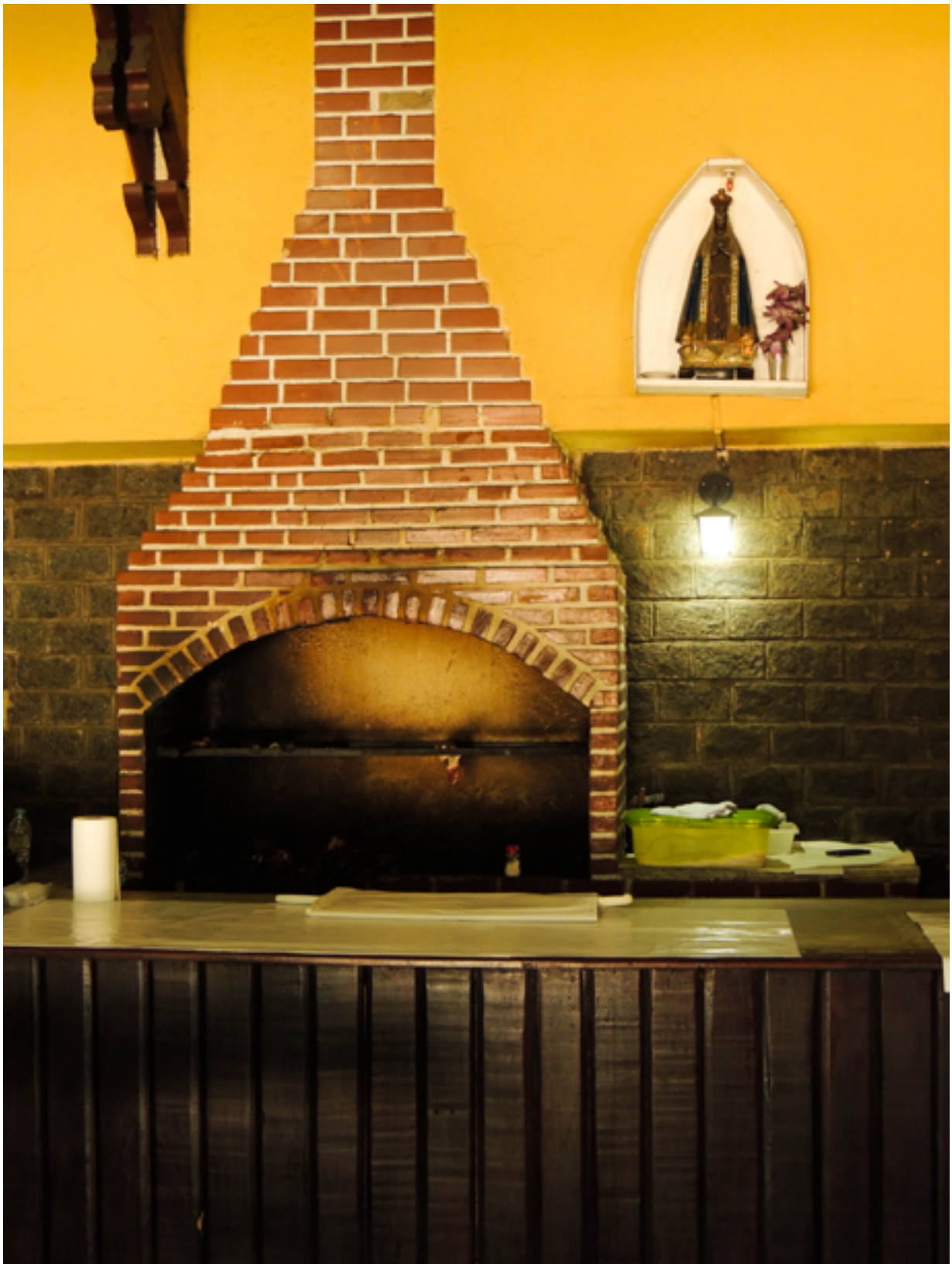
Churrascaria em Seropédica (RJ), 2016.