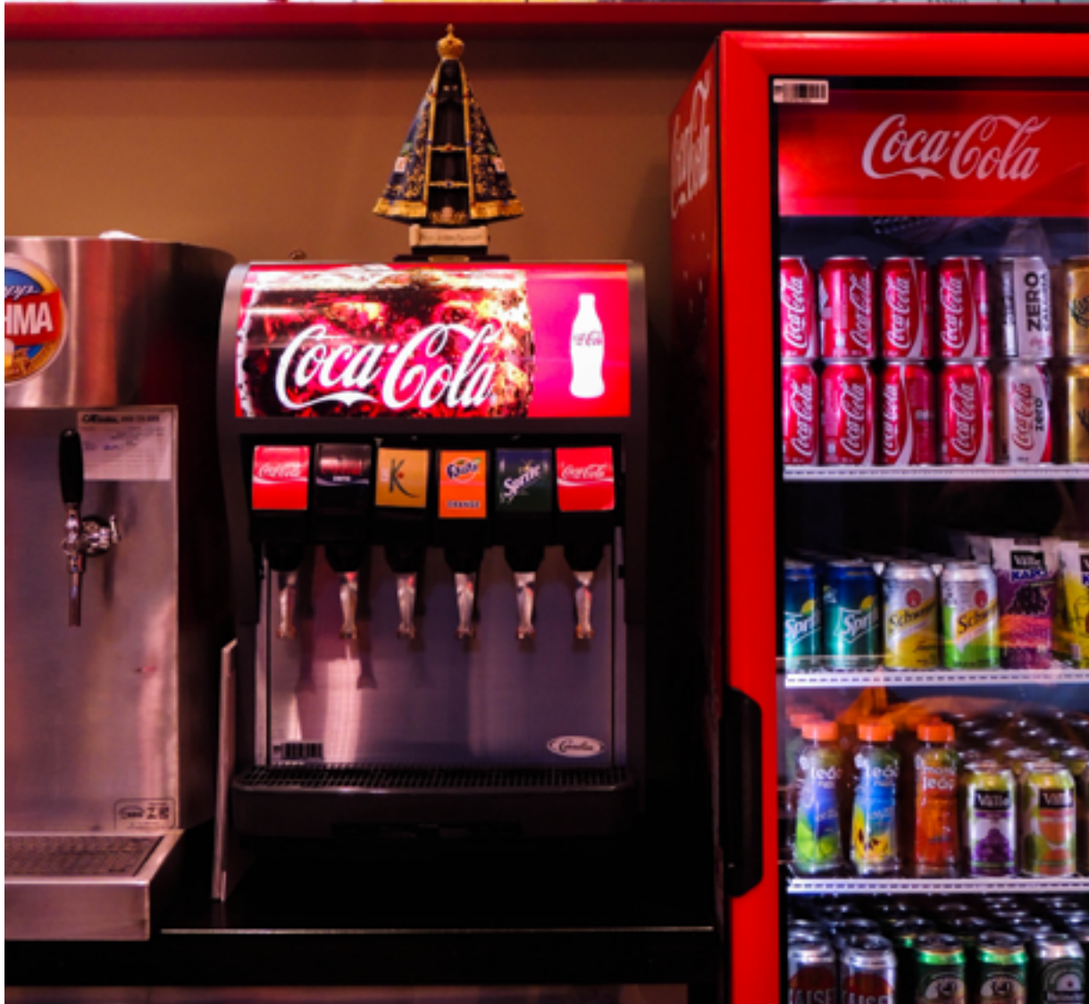
Lanchonete em Aparecida (SP). 2015