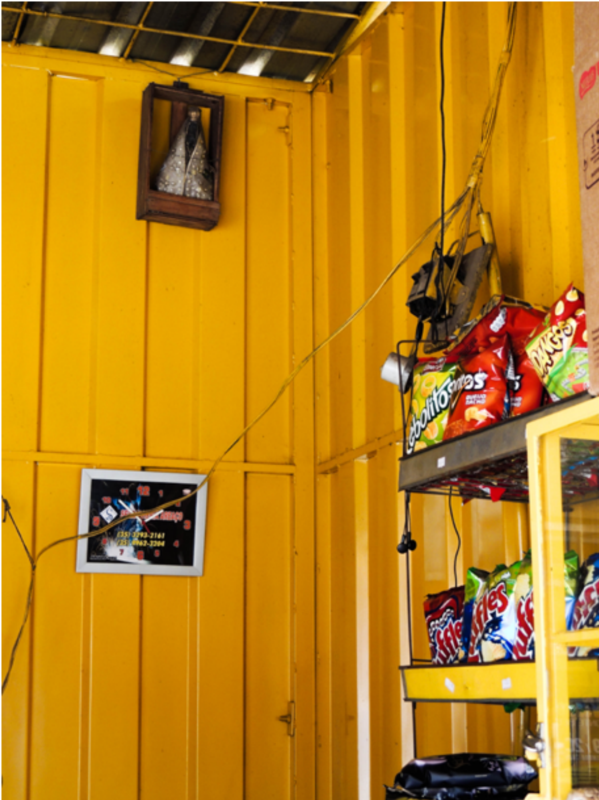
Banca de doces em Areado (MG). 2015.