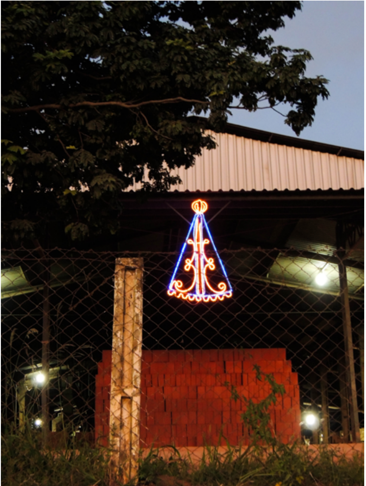
Olaria em Canas (SP). 2016.