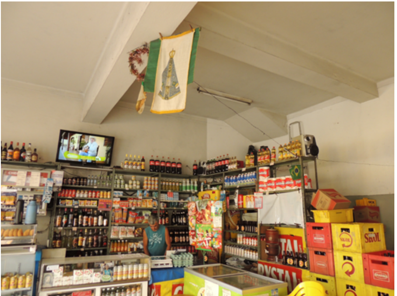
Bar e Merceria em Aparecida (SP), 2017.