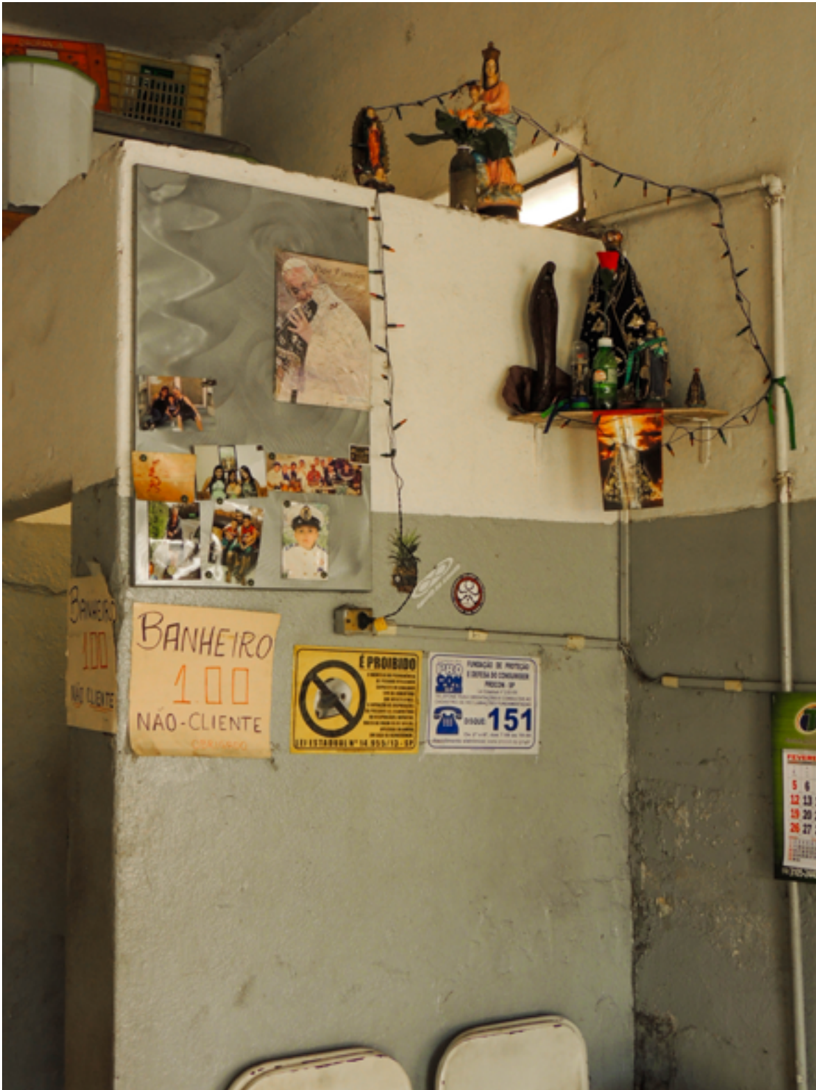
Bar em Aparecida (SP), 2017.