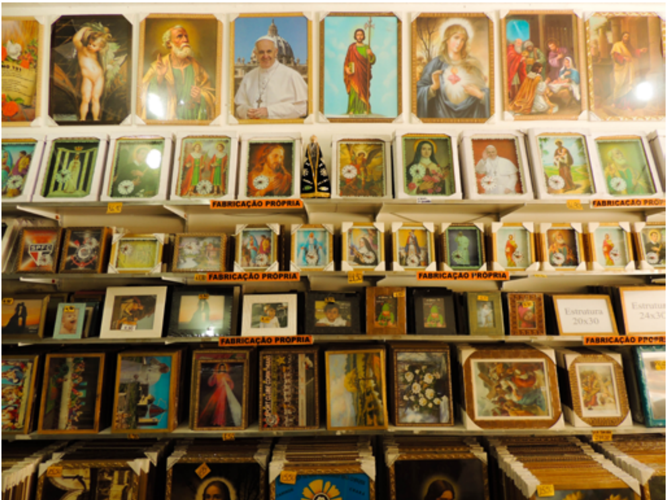
Fábrica e loja de quadros em Aparecida (SP), 2017.