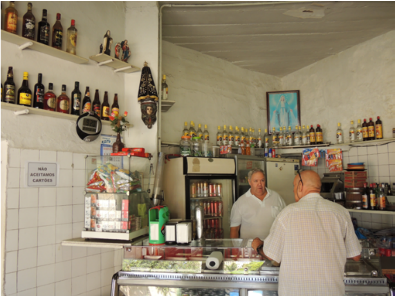
Bar em Aparecida (SP), 2017.