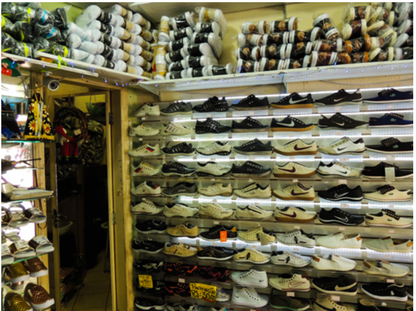
Loja de sapatos em Aparecida (SP). 2017.